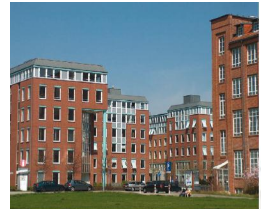
Dienstszitz Berlin, DGZ-Ring 12